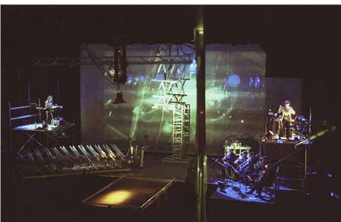
Armageddon, 2004.