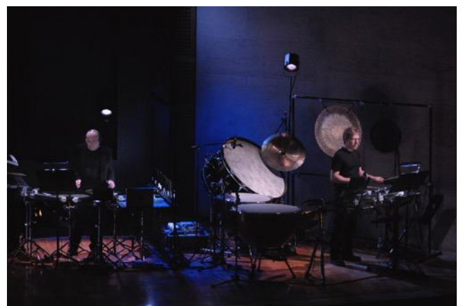
La chute de la maison Usher, 2008.