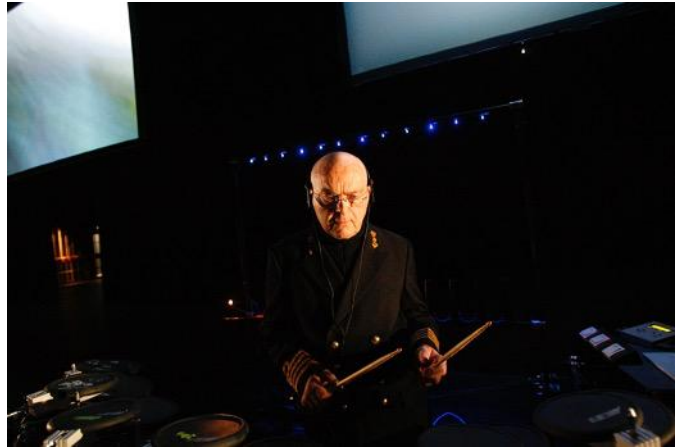
Eyecatcher, 2007