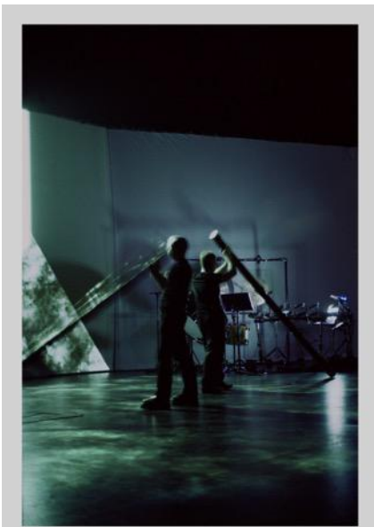
ART ZOYD : Le champ des larmes