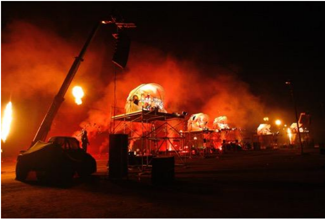
Fleuves des lumières, 2007.