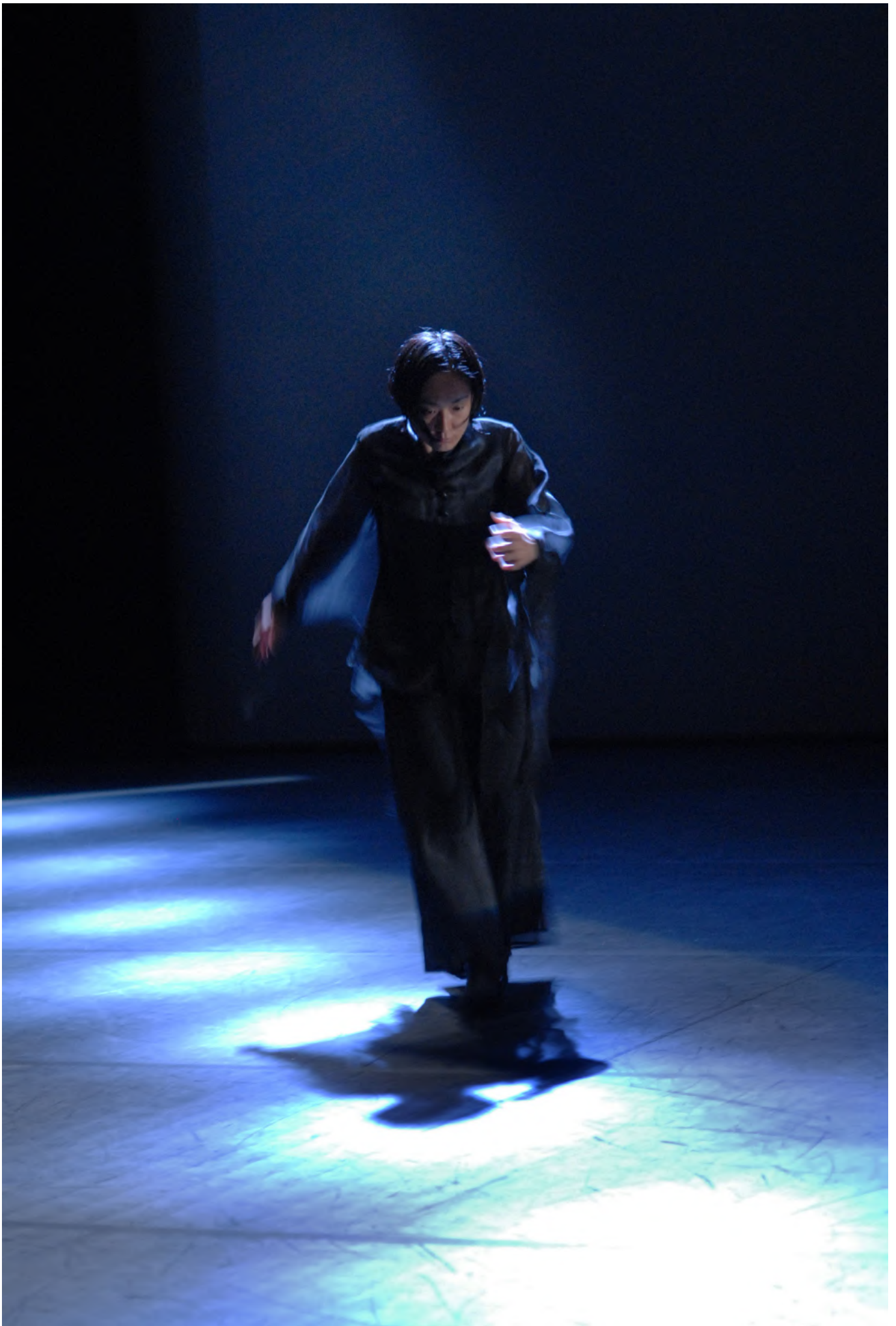
Akiko Kitamura, Les Particules noires, 2010.